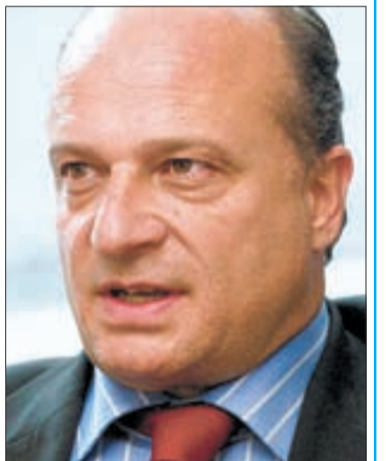
FDP-Nationalrat Filippo Leutenegger.

In eine ähnliche Richtung zielt auch die Motion von FDP-Nationalrat Filippo Leutenegger, über die der Ständerat in dieser Herbstsession ebenfalls befinden wird. Der Hintergrund: Wer bei der Renovation oder beim Umbau seiner Liegenschaft Energie spart oder die Umwelt schützt, kann nach geltendem Gesetz die Kosten dafür bei der direkten Bundessteuer abziehen. Leu-