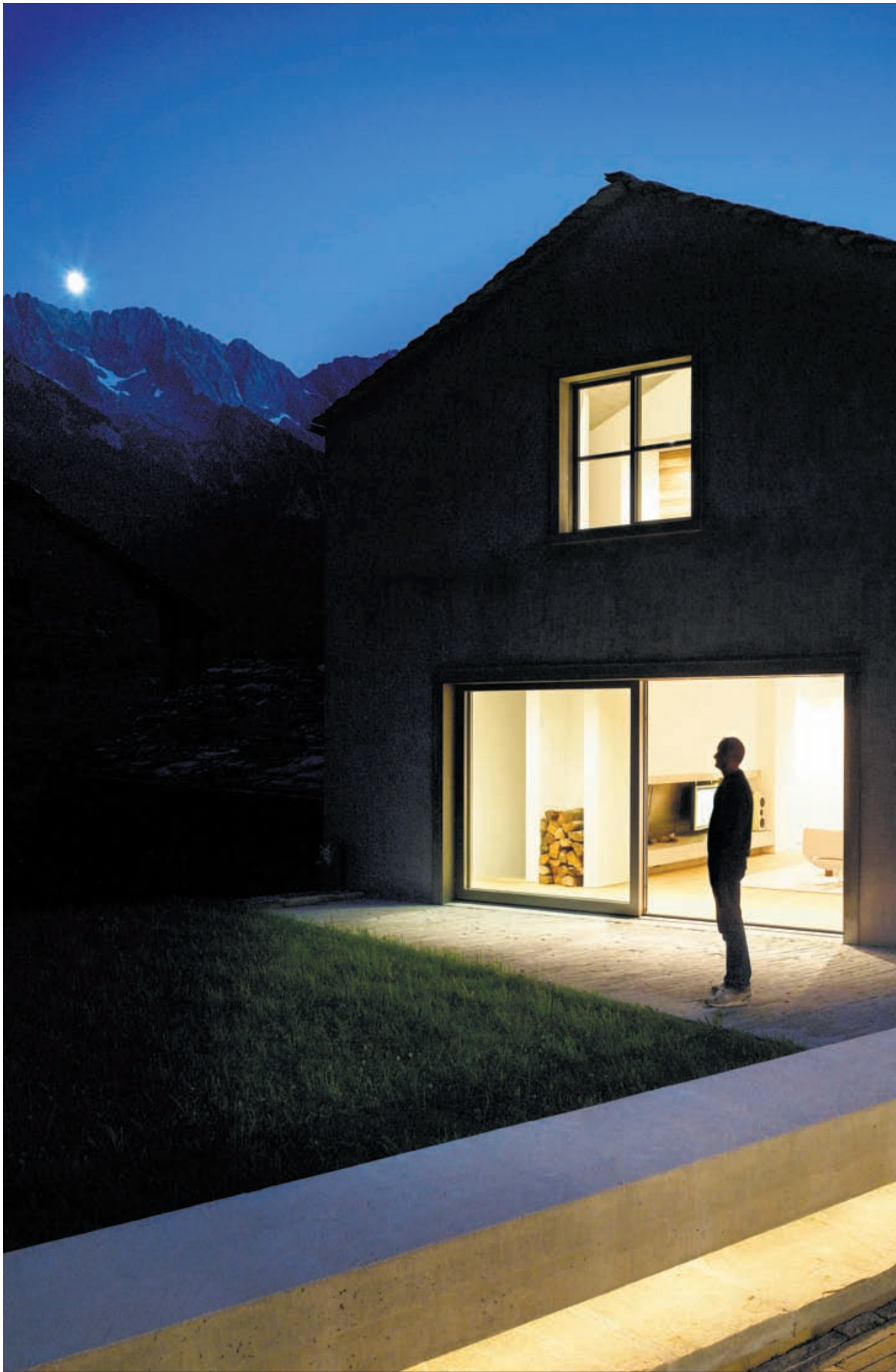
Schöne Aussichten: Wer sein Haus energetisch saniert, kann viel Strom sparen und auf Fördergelder zählen.